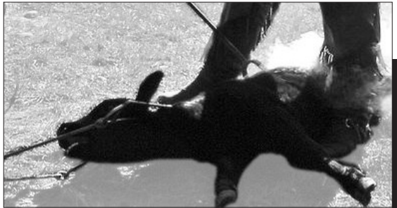
L'appropriazione: gli animali vengono marchiati a fuoco così come lo erano i Neri e le donne nei secoli scorsi (illustrazioni a pag. 7).

logica la risposta dovrebbe essere: tutti quelli che sono sensibili a tali comportamenti. In pochi casi una «differenza naturale», all'occorrenza di specie 10 , è usata con così poche precauzioni per definire una frontiera morale. Per coloro che in tal modo sono stati esclusi, si ammette non solo che il loro bene si identifica con «ciò che la natura ha previsto per loro», ma, all'occasione, con ciò per cui ci sono utili: i gatti sono fatti per acchiappare i topi, le pecore per essere tosate e i polli per essere arrostiti.