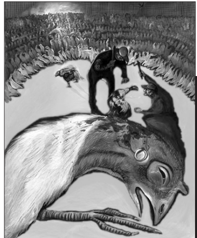
Separate sick turkeys: Immagine di S. Coe – Macellazione dei tacchini malati in seguito a separazione.

In realtà, se bisogna stabilire delle differenze radicali nel reale, non bisogna cercarle nell'opposizione fra naturale e umano, fra naturale e sociale, fra naturale e artificiale, fra innato e acquisito 14 ecc. Da un punto di vista sia scientifico, sia filosofico che etico, non è la distinzione fra supposti «esseri liberi» ed «esseri naturali» ad essere pertinente, ma quella fra materia sensibile ed inanimata, fra cose reali che provano delle sensazioni, hanno dei desideri e di conseguenza agiscono in funzioni di obiettivi propri, e altre cose che non hanno sensazioni né interessi, che non attribuiscono nessun valore agli avvenimenti e alcun fine alla loro esistenza. Fra esseri sensibili e cose insensibili, in breve, fra gli animali e i sassi o le piante. Ancor più della presenza di una coscienza riflessiva, il «semplice» fatto che in determinati casi la materia sia capace di provare delle sensazioni è l'enigma più impressionante; la spiegazione di un tale mistero è la sfida che dovranno raccogliere le scienze nel corso di questo nuovo secolo.