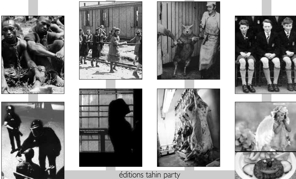
éditions tahn party