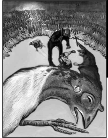
Separate sick turkeys : Illustration de Susan Coe. Abattage des dindes malades après séparation.

et humain, naturel et social, naturel et artificiel, inné et acquis 14 , etc. D'un point de vue scientifique, philosophique tout autant qu'éthique, ce n'est pas cette distinction entre supposés « êtres de liberté » et « êtres de nature » qui semble désormais pertinente, mais bien plutôt celle entre une matière sensible et une matière inanimée, entre ces choses réelles qui éprouvent des sensations, qui dès lors ressentent des désirs et de ce fait agissent en fonction de fins qui leur sont propres, et ces autres choses qui n'éprouvent rien, n'ont pas d'intérêts, auxquelles rien n'importe, qui ne donnent aucune valeur aux événements et aucun but à leur existence. Entre les êtres sensibles et les choses insensibles, entre les animaux, pour faire vite, et les cailloux ou les plantes. Plus encore que l'existence d'une conscience réflexive, le « simple » fait que la matière puisse dans certains cas se révéler capable d'éprouver des sensations est d'ailleurs une impressionnante énigme, et l'explication de ce mystère sera sans doute le défi que devront relever les sciences au cours de ce siècle naissant.