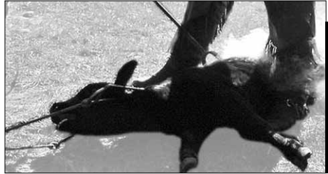
L'appropriation : on marque au fer les animaux comme on marquait les Noirs et les femmes les siècles précédents (illustrations page 7).

Il y a plus de deux siècles déjà, Jeremy Bentham résumait en ces termes les objections que soulève une attitude spéciste : « Les Français ont déjà découvert que la noirceur de la peau n'est en rien une raison pour qu'un être humain soit abandonné sans recours au caprice d'un bourreau. On reconnaîtra peut être un jour que le nombre de pattes, la pilosité de la peau, ou la